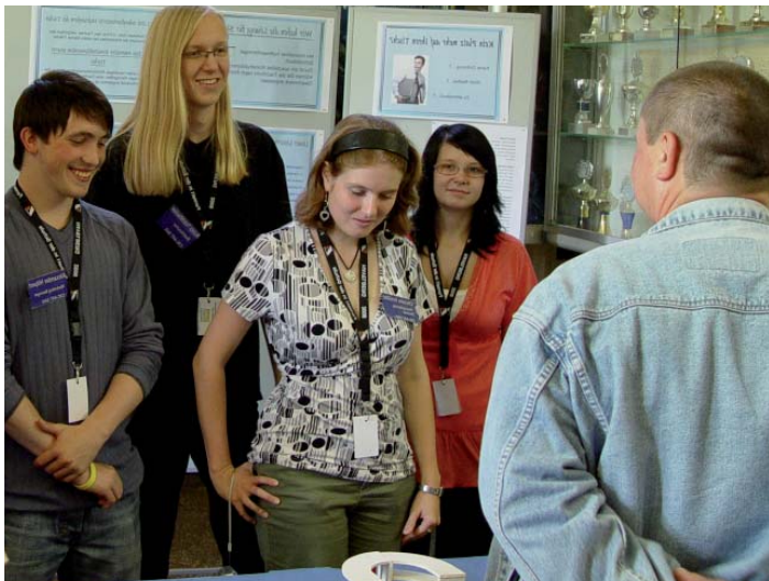
Schülerstudienwoche 2008

Das Schüler-Institut SITI e. V. Havelberg ist neuer GRÜNDER-KIDS-Partner! Eins der vielen Angebote, an denen ihr teilnehmen könnt, ist die Studienwoche. Ziel ist es, eine fiktive Schülerfirma von der eigenen Produktidee bis zum fertigen Prototyp zu entwickeln.