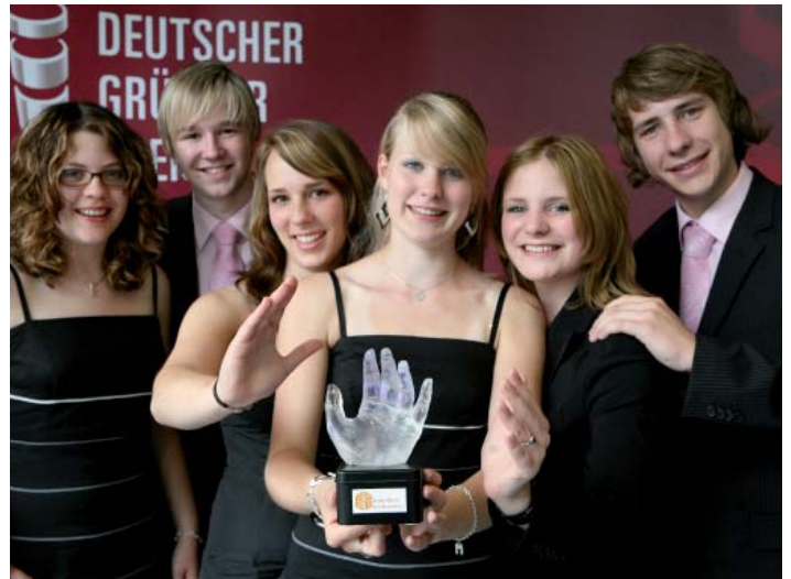
Siegerteam 2008: Education Electronics

Der Deutsche Gründerpreis für Schüler wird an das bundesweit beste Team des Existenzgründer-Planspiels vergeben. Teilnehmen können Jugendliche ab 16 Jahren. Bei erfolgreichem Abschluss des Spiels gibt es ein individuelles Juryfeedback und ein Teilnahmezertifikat für spätere Bewerbungsunterlagen.