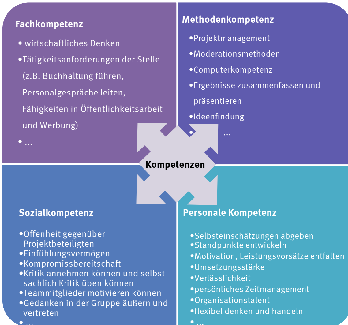
Grafik 2: Beispiele für in der Schülerfirma erworbene Kompetenzen und ihre Systematisierung